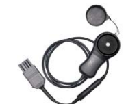
Lux Sonde LP-10B mit dem WS-06 Stecker