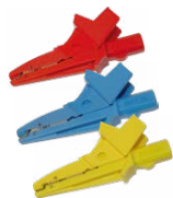
Krokodilklemme 1 kV 20 A rot / blau / gelb